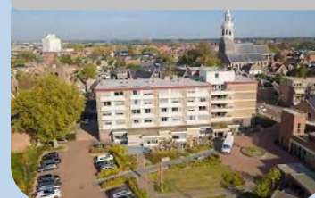
St Jozef Nijkerk