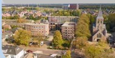
St Jozef Hooglanderveen